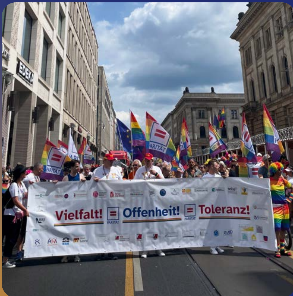
Erstmals dabei bei der Pride-Demonstration in Berlin am 22. Juli 2023 unter dem Motto „Vielfalt! Offenheit! Toleranz!“, der Paritätische mit vielen seiner Mitgliedsorganisationen.