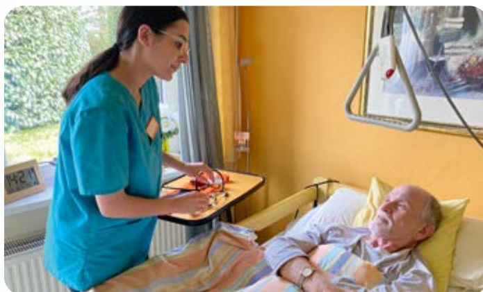
Zeit für gute und personenbezogene Pflege und Betreuung wird durch immer neue Standards, Statistiken und Dokumentationspflichten zunichte gemacht.

Ich glaube, dass man hier verschiedene Bereiche klar unterscheiden muss. Da sind einmal die Rahmenbedingungen, die die tägliche Arbeit in den Einrichtungen betreffen. Es fängt an bei dem vielzitierten Bürokratismus. Selbst das hochgelobte „SIS“-Modell („Strukturierte Informationssammlung“) in der Pflegeplanung und -dokumentation ist aus unserer Erfahrung schon an seine Grenzen gestoßen. Immer neue Standards, Statistiken, Dokumentationspflichten und Meldungen machen jeglichen Zeit-