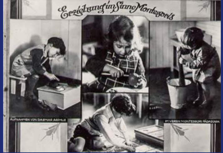
Impressionen aus einem Berliner Montessori-Kindergarten im Jahr 1926.

Markt frei walten lässt und dann zu spät feststellt, dass Wohnungen fehlen, weil es der Markt offensichtlich nicht richtet. Es kann nicht sein, dass im pflegerischen Bereich große Summen an ausländische Investoren abfließen, die hier ihr Geschäft machen mit pflegebedürftigen Menschen. Neben einer 180-Grad-Wende in der Steuer- und Finanzpolitik wäre für mich deswegen zentral, Gemeinnützigkeit und Gemeinwohlorientierung im Bereich der Daseinsvorsorge wieder in den Mittelpunkt zu stellen.