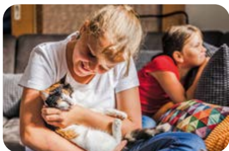
Das Kinderdorfhaus „Leuchtfeuer“ auf der Insel Usedom bietet sieben Kindern, die nicht in ihren Ursprungsfamilien leben können, ein zweites Zuhause.

Das zusätzliche Angebot der Erziehungsstellen (§ 27 und § 34 SGB VIII) richtet sich an Kinder mit psychischen und sozialen Beeinträchtigungen, die ein überschaubares Umfeld und eine kontinuierliche Bezugsperson brauchen. Bis zu zwei Kinder und eine pädagogisch qualifizierte Erziehungsstellenleitung sowie deren Lebenspartner*in bilden eine Lebensgemeinschaft. Im Krankheitsfall oder während eines Urlaubs organisiert das Familienwerk eine Vertretung.