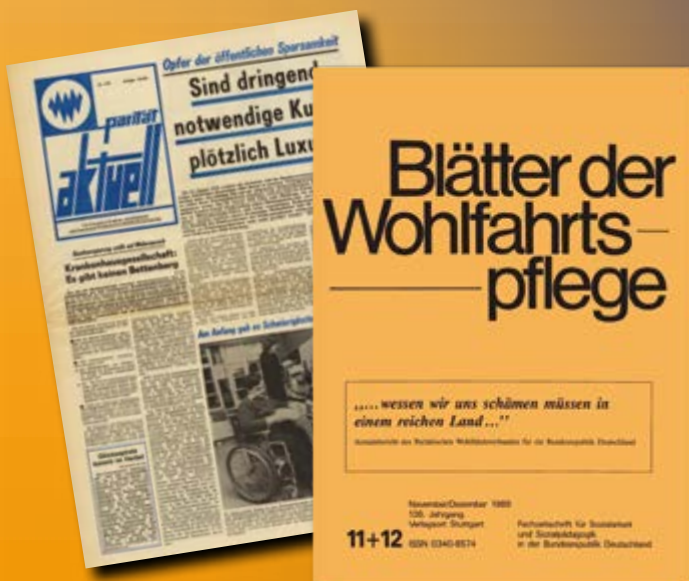
Ausgabe des Verbandsmagazins des Paritätischen von 1976. Cover des ersten Armutsberichts von 1989 (rechts).

Als Zweites würde ich den absoluten Vorrang für gemeinnützige Angebote in allen Bereichen der Daseinsvorsorge verpflichtend machen. Der Paritätische und ich sind der festen Überzeugung, dass Menschen keine Ware sein dürfen. Wir sind der festen Überzeugung, dass Gewinnorientierung in Sektoren wie Pflege, Bildung, Gesundheit und Soziales nichts verloren hat. Hier hat Gemeinnützigkeit zu herrschen, sprich Verzicht auf private Mitnahme und eine konsequente Orientierung am Gemeinwohl. Es kann nicht sein, dass man wie etwa auf dem Wohnungsmarkt den